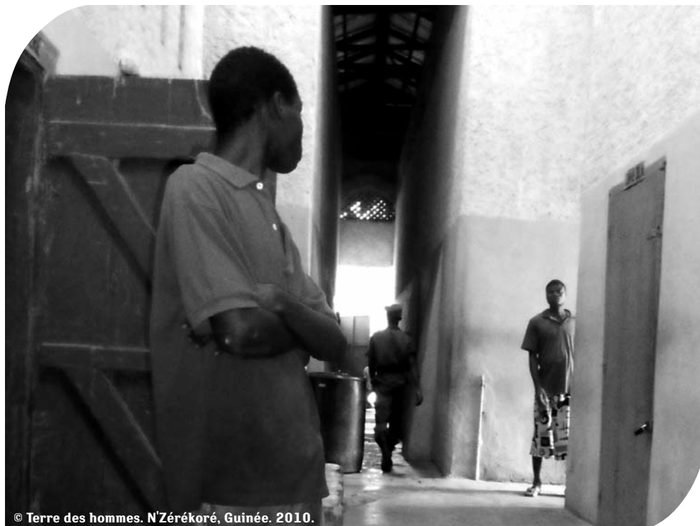
N'Zérékoré, Guinée. 2010.