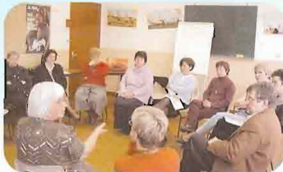
Formation des catéchistes Atelier "mise en scène"

Cette question est revenue à plusieurs reprises au cours des réunions des responsables des services diocésains. On l'a exprimée sous le terme de " passerelles " à établir entre mouvements et services. Les premiers résultats sont très positifs. Continuons dans ce sens.