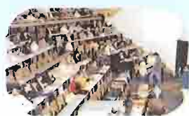
Assemblée synodale à l'université