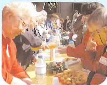
Fête de la solidarité

Il y a un certain déficit sur ce point. Efforçons-nous de le réduire. L'annonce de l'évangile a tout à y gagner.