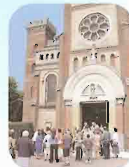
Sortie de l'Eglise du Sacré-Coeur - Paroisse de la Pentecôte au Havre