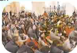
Passion 2004 - Les jeunes se retrouvent pour un temps de méditation