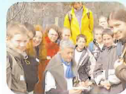
Fête des C 4/3 et C 2/1

- Dans la plupart des autres paroisses, j'ai rencontré, une présence significative des jeunes. (chorales, orchestres, servants d'autel, scouts et guides, C4-3, C2-1, JOC-JOCF, JEC, jeunes des aumôneries scolaires, etc). Mais trop souvent ces jeunes semblent constituer des groupes d'un monde à côté des préoccupations de la vie paroissiale ordinaire. La pastorale des enfants et des jeunes est constitutive de la pastorale locale, parce qu'il y a des familles en cause, des situations sociales, et qu'ils sont concernés par la liturgie, les sacrements, le catéchuménat et la mission en général. Les EAP et les Conseils pastoraux se saisiront de cette question.