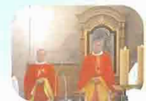
Passation du siège épiscopal le 17.10.03