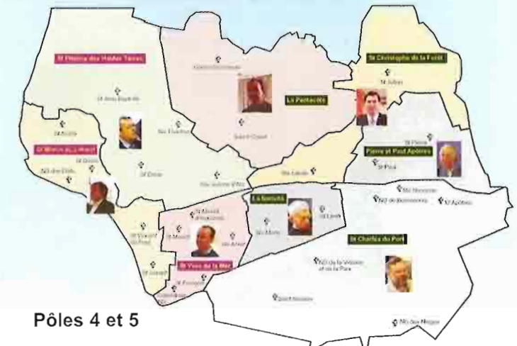
Pôles 4 et 5