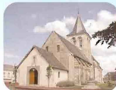
Eglise Notre-Dame de l'Assomption d'Angerville-l'Orcher Paroisse Saint Gabriel Cap de Caux

L e souci premier des pasteurs et des responsables laïcs doit être de mettre en place les moyens d'évangélisation pour le territoire qui la constitue. C'est le rôle de l'E.A.P. et du Conseil pastoral. Il ne s'agit donc, ni de plaquer des formules toutes faites, ni de sauvegarder des habitudes du passé pour ne pas déplaire à quelques-uns. Cela demande une attention vive aux réalités humaines, une pédagogie patiente mais ferme pour que les paroissiens comprennent peu à peu que les changements ne signifient pas la désertion.