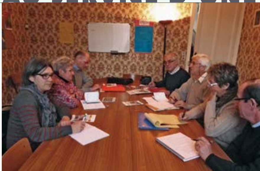
EAP de Lillebonne.

L'Église, missionnaire par nature, doit sans cesse élargir son regard, avancer au large avec, pour horizon, l'annonce de l'Évangile aux «périphéries».