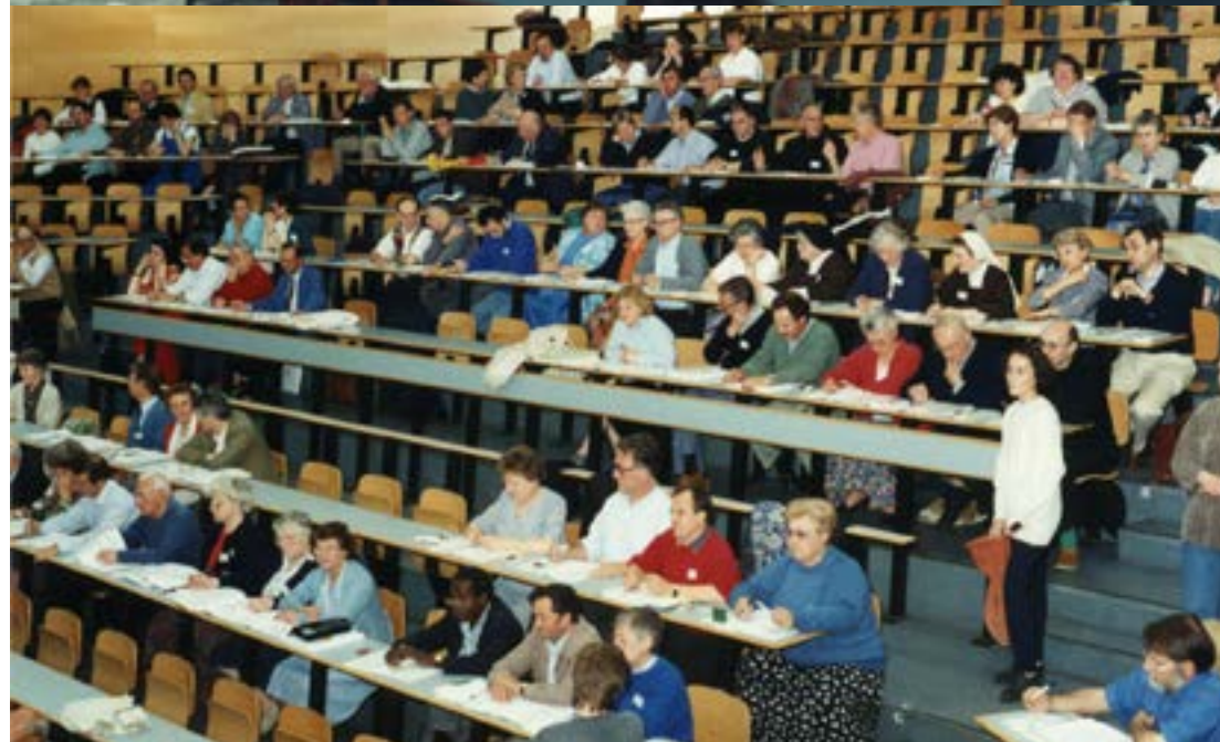
Assemblée synodale en 1994. Des principes de gouvernance des paroisses sont nés de ce synode diocésain. Une gouvernance synodale dans les paroisses permettrait de faire le point régulièrement de nos avancées pour l'annonce de l'Évangile et le service des frères