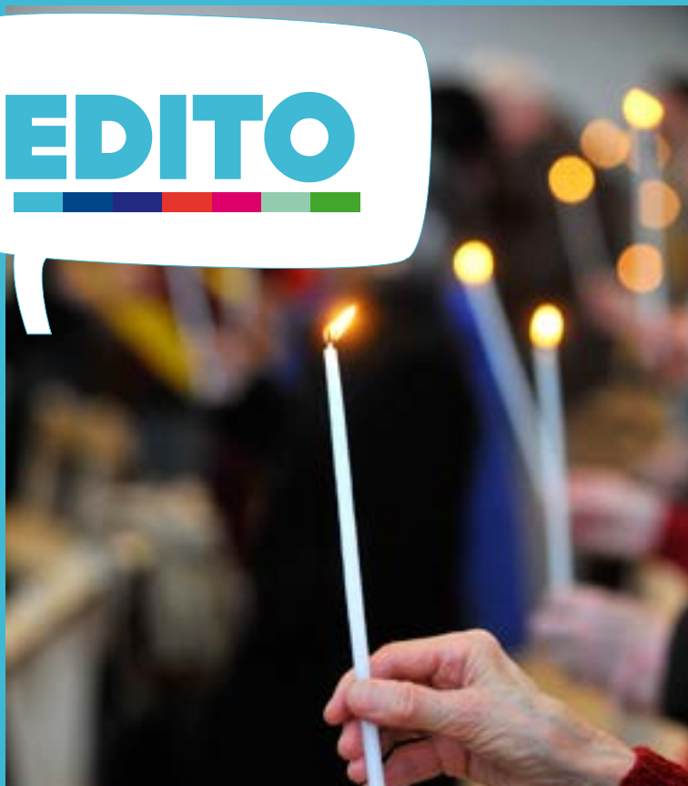
Messe de Pâques dans l'église Saint-Thomas à Vaulx-en-Velin, en mars 2013.