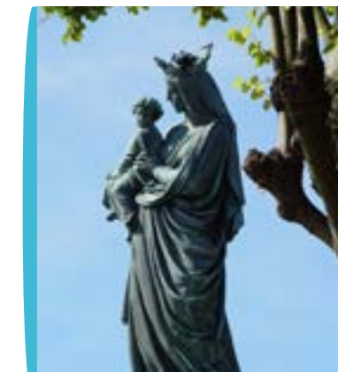
La Vierge Noire à Gravelle.