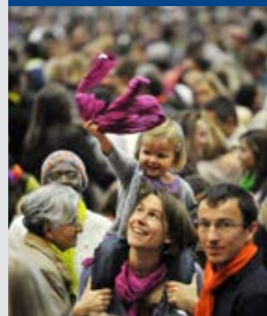
14 octobre 2012: Fête diocésaine de Lyon.