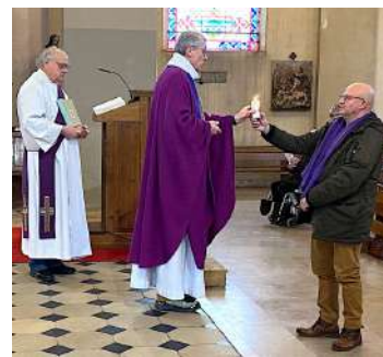
L'appel décisif de Malick lors du 4 e dimanche de Carême en l'église de Gonneville la Mallet.