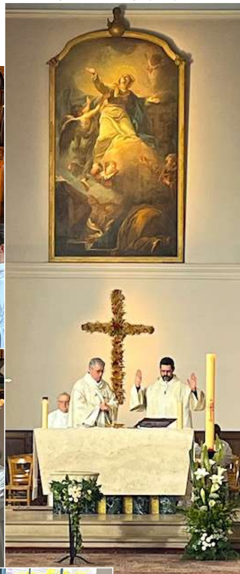
L'Ascension de la Vierge parfaitement mis en valeur grâce à un éclairage spécifique.