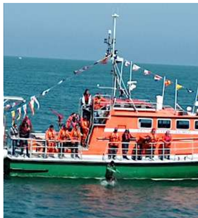
La vedette de la SNCM présente à l'appel.