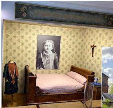
Les Buissonnets une chambre et le salon. Le jardin avec la statue de Thérèse suppliant son père de la laisser rentrer au Carmel.

Retour sur : Le pèlerinage paroissial à Lisieux