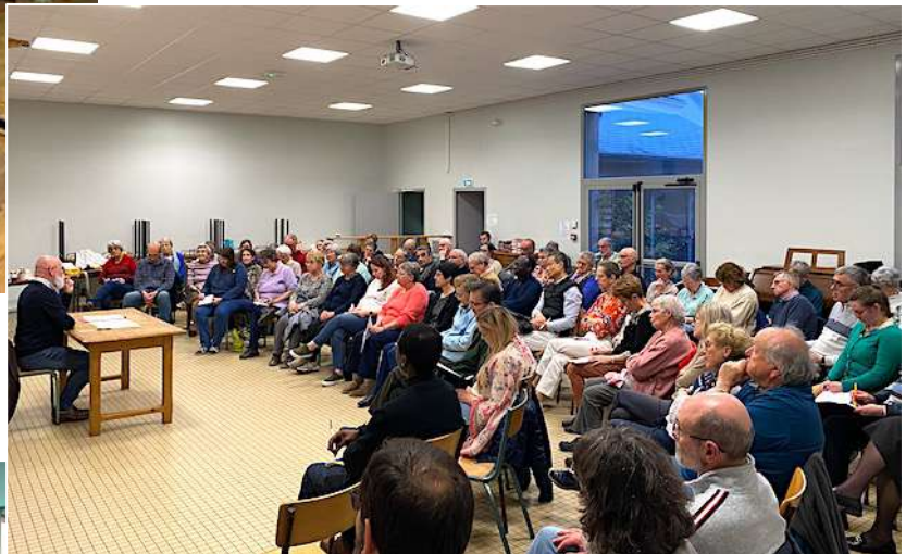
2 e soirée à Montvilliers