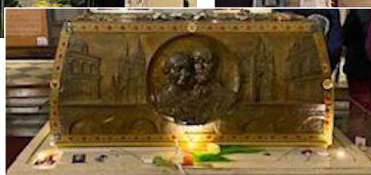
Basilique Sainte Thérèse reliquaire de Louis et Zélie Martin.