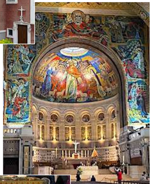
Basilique Sainte Thérèse.