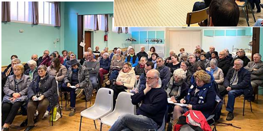
3 e soirée à Saint Romain de Colbosc