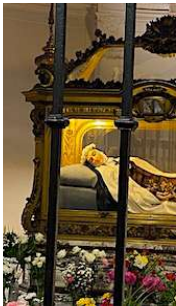
Carmel, châsse de Sainte Thérèse.