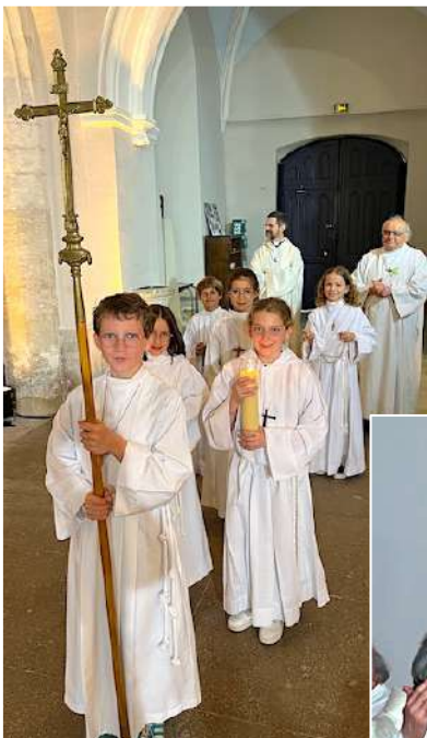
Une équipe de servants de messe très motivés.