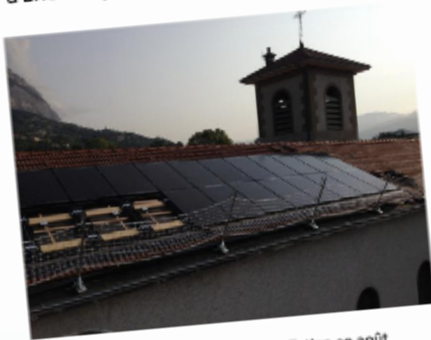
Le toit de St Ferjus en phase d'installation en août 2017, merci à Enercoop et Energ'Y citoyennes pour la photo.

Dans la ville de La Tronche (près de Grenoble), l'église de Saint Ferjus a été « solarisée » en 2017 grâce à un projet citoyen sur 15 toitures, « Energ'Y citoyennes » qui a obtenu le soutien de la métropole et d'Enercoop.