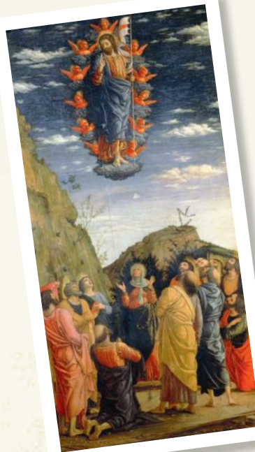
← L'Ascension du Christ, par Andrea Mantegna au xv e siècle.

Jésus disparaît aux yeux de ses disciples dans une nuée. La nuée est une sorte de nuage mystérieux que l'on trouve dans la Bible dès que Dieu se manifeste aux hommes. Elle est une façon pour Dieu de rester caché tout en montrant sa présence.