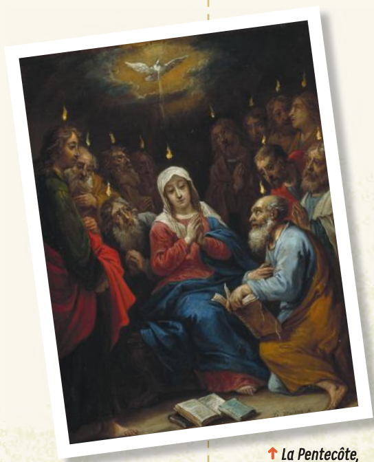
↑ La Pentecôte, par Teniers David au XVII e siècle.