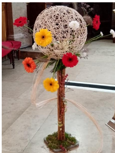
Composition florale Cathédrale